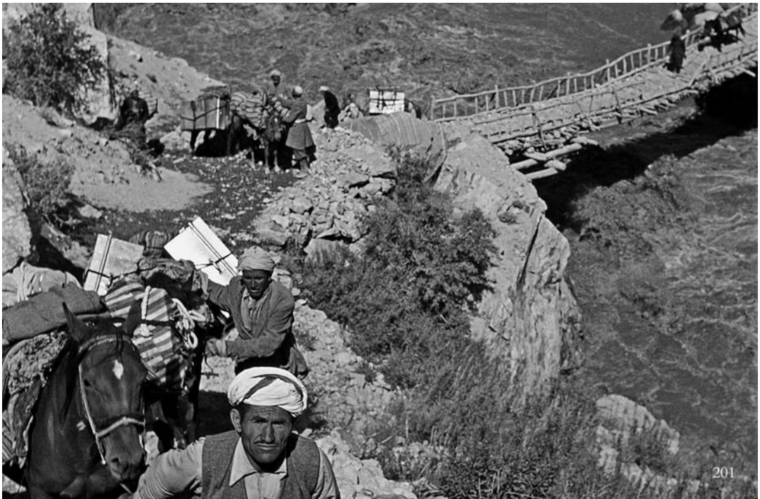
Abbildung 3. Teil der Karawane der „Wakhan-Expedition“ von 1971. Das Foto lässt Mühen und Gefahren erahnen, die alle Teilnehmer auf sich nahmen.

In Kapitel 18 reisen NAUMANN und EBERT „Auf Umwegen in den Badakhshan“ und „Noch einmal nach Paktia“, zum oben erwähnten, von der Himalaja-Zeder ( Cedrus deodara ) geprägten „Deodar-Wald“, unter anderem, um Zygaenen (Widderchen), NAUMANNS „Spezialität“, zu sammeln. Weiter geht es „Nach Nuristan“, dem „Land des Lichtes“ (dem früheren Kafirestan), und zur alten Seidenstraße. Kapitel 19 bis 22 behandeln schließlich die „Wakhan-Expedition“. In den Wakhan kommt man auch heute noch nur mit Pferd und Yak, im Ort Iskashem (Ishkashim) endet die Straßenpiste, und damit jegliche Möglichkeit der Weiterfahrt für eine Lorry (den Lastkraftwagen Afghanistanens) oder ein anderes vierrädriges